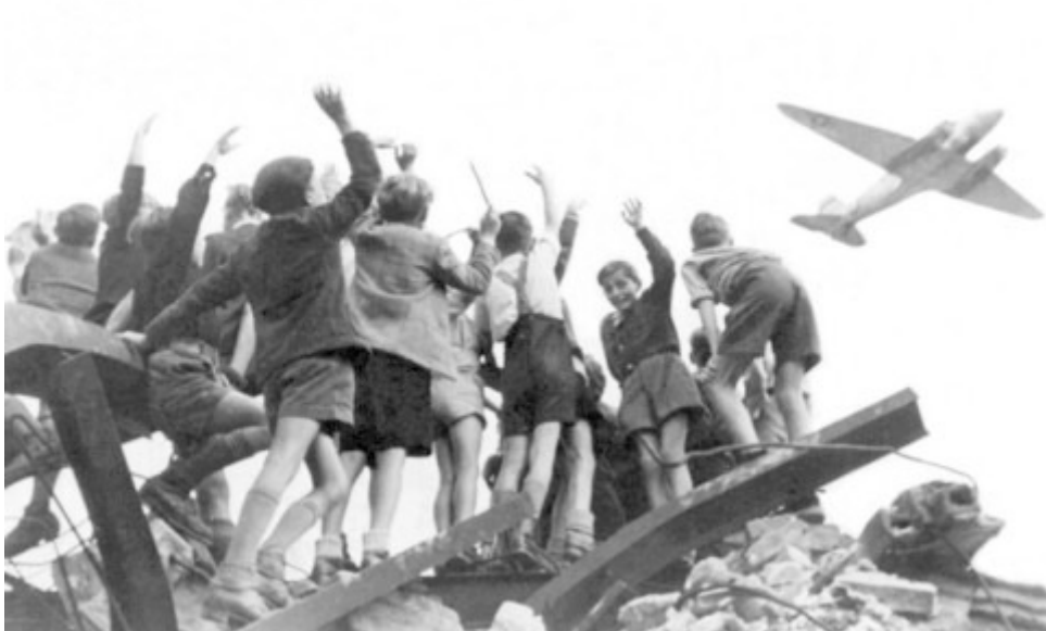
Foto: dpa Die Sowjetunion wollte die West-Berliner aushungern - und scheiterte. Im Mai 1949 wurde die Blockade wieder aufgehoben. Die Luftbrücke war beendet.

Foto: dpa Mit der Währungsreform war das wirtschaftliche Fundament Westdeutschlands geschaffen. Die Sowjetunion reagierte mit der Berlin-Blockade. Die West-Alliierten versorgten West-Berlin dann aus der Luft mit Lebensmitteln.