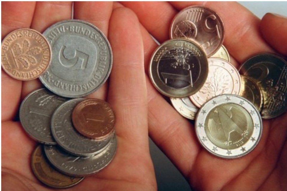
Deutsche Mark vs. Euro

Der Euro ist zumindest bis 2006 ebenso stabil wie die D-Mark - seit einem guten Jahr nimmt die Inflation in der Eurozone jedoch deutlich zu. Doch viele misstrauen dem Euro nach wie vor...