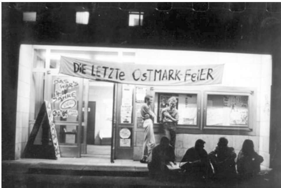
Am Abend zuvor konnten die Menschen noch ihre letzten Bargeld-Bestände in Ostmark auf den Kopf hauen, wie in diesem Berliner Club.