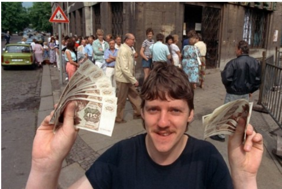
Foto: dpa Dieser Mann steht vor der Sparkassenfiliale in Leipzig an der Karl-Liebknecht-Straße / Ecke Hohestraße. Auf den Montags-Demos hatten Tausende zuvor skandiert: "Kommt die D-Mark nicht zu uns, gehen wir zu ihr!"

Foto: dpa Am 1. Juli 1990 hoben die DDR-Bürger an rund 15.000 Auszahlungsstellen etwa drei Milliarden D-Mark ab. Wieder galt ein Tauschkurs von 1:1 bei Löhnen, Mieten und Renten zur DDR-Mark. Sparguthaben wurden nur bis zu einem Grenzbetrag von maximal 6000 DDR-Mark 1:1 getauscht, darüber hinaus im Kurs 2:1.