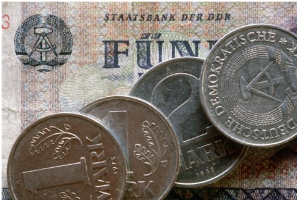
Das DDR-Geld ist heute bei Sammlern begehrt - kaufen kann man sich damit nichts mehr.