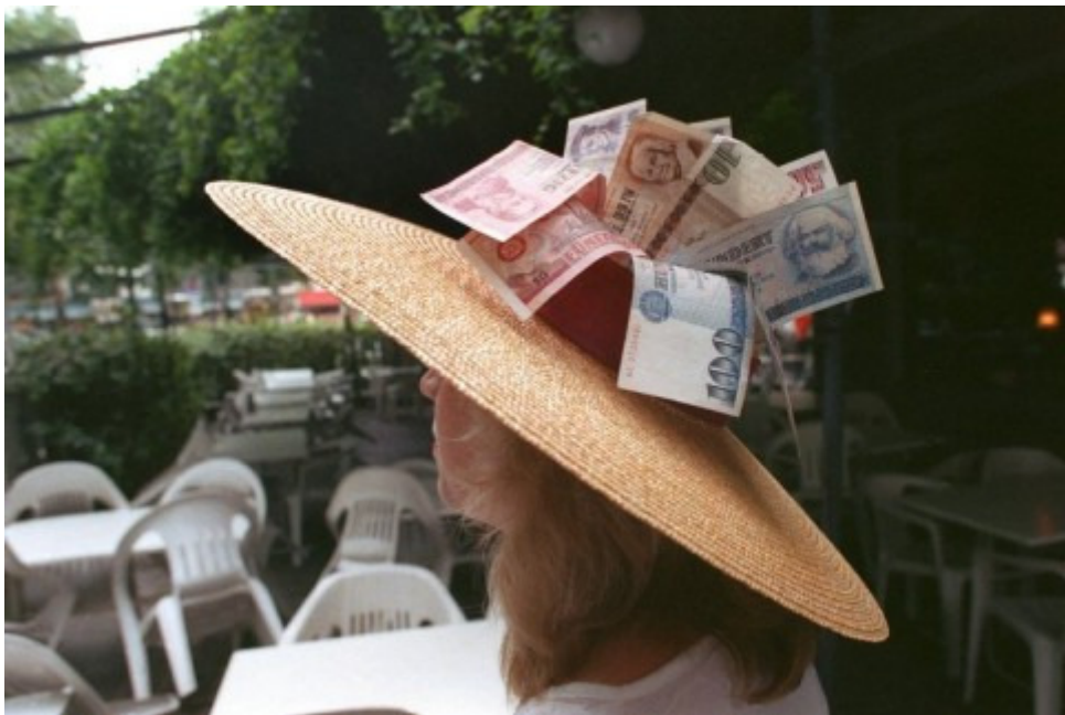
Diese junge Frau steckte sich das alte Ost-Geld an den Hut. Auf dem ebenfalls blauen Hunderter der DDR war übrigens der Philosoph und Vordenker des Sozialismus, Karl Marx (1818 bis 1883), zu sehen.