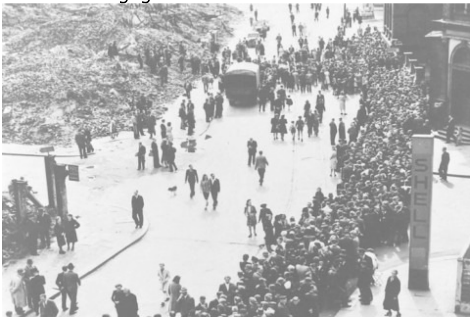
Schlange stehen: Auf das neue Geld mussten die Menschen wie hier vor dem Hamburger Wirtschaftsamt stundenlang warten.

Jeder Bürger im Westsektor erhielt zunächst am 20. Juni 1948, einem Sonntag, 40 Mark Kopfgeld. Zugleich hob der spätere Wirtschaftsminister Ludwig Erhard die Rationierung der Waren auf - gegen den Willen der Westmächte.