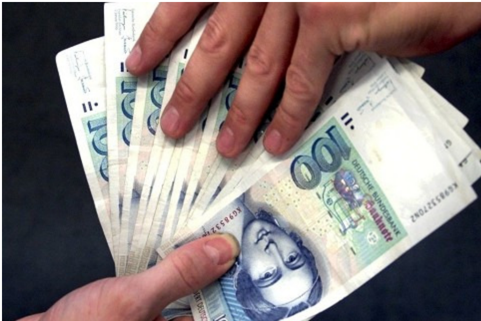
Doch kaum hatten sich die Menschen an die neue Optik der Mark gewöhnt (der Hunderter zeigt die Pianistin Clara Schumann, sie lebte von 1819 bis 1896), plante die Europäische Union schon den nächsten Schritt.