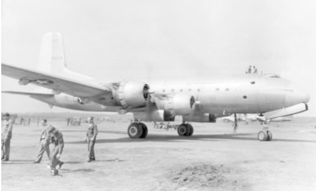
Mit der Währungsreform war das wirtschaftliche Fundament Westdeutschlands geschaffen. Die Sowjetunion reagierte mit der Berlin-Blockade. Die West-Alliierten versorgten West-Berlin dann aus der Luft mit Lebensmitteln.