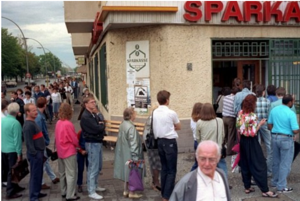
Am 1. Juli 1990 hoben die DDR-Bürger an rund 15.000 Auszahlungsstellen etwa drei Milliarden D-Mark ab. Wieder galt ein Tauschkurs von 1:1 bei Löhnen, Mieten und Renten zur DDR-Mark. Sparguthaben wurden nur bis zu einem Grenzbetrag von maximal 6000 DDR-Mark 1:1 getauscht, darüber hinaus im Kurs 2:1.