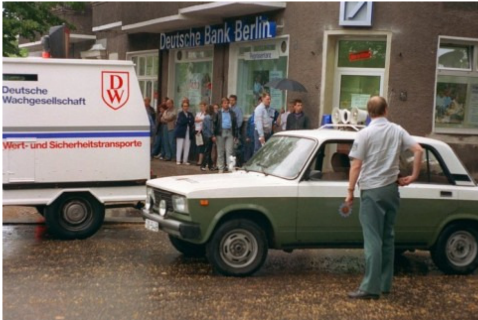
Die Bürger der DDR bekamen die D-Mark erst 42 Jahre nach der Einführung im Westen: am 1. Juli 1990. Die DDR-Bürger standen Schlange vor den Bank-Filialen wie hier in Berlin-Friedrichshain.