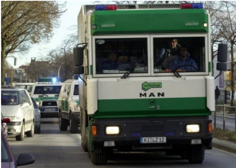
Bereits der Maastricht-Vertrag der EU von 1992 sieht eine Währungsunion vor. In elf EU-Ländern galt ab 1999 auf dem Papier schon die gemeinsame Währung Euro. Kurz vor der Währungsreform am 1. Januar 2002 rollten dann die Geldtransporte durchs Land.