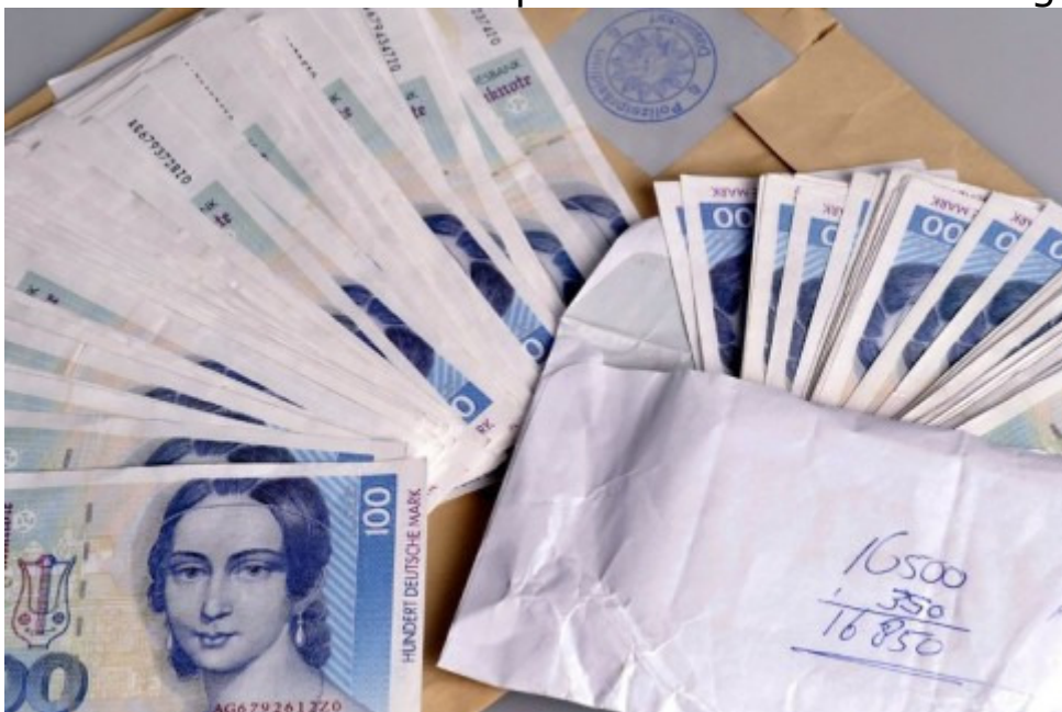
Auch D-Mark-Blüten - Falschgeld - tauchten immer noch auf. Die Polizei in Düsseldorf stellte im April 2008 noch 168 falsche 100-Mark-Scheine sicher, die ein Niederländer bei der Bundesbank in Euro tauschen wollte.

Unbrauchbar: Über die Landesbanken ausrangierte Markstücke werden mehrfach verbogen. Aus dem geschmolzenen Rohstoff werden später wieder Eurostücke geprägt.