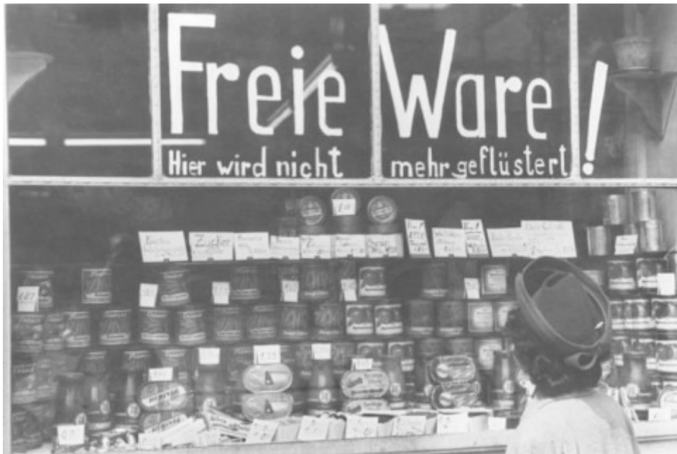
Jeder Bürger im Westsektor erhielt zunächst am 20. Juni 1948, einem Sonntag, 40 Mark Kopfgeld. Zugleich hob der spätere Wirtschaftsminister Ludwig Erhard die Rationierung der Waren auf - gegen den Willen der Westmächte.