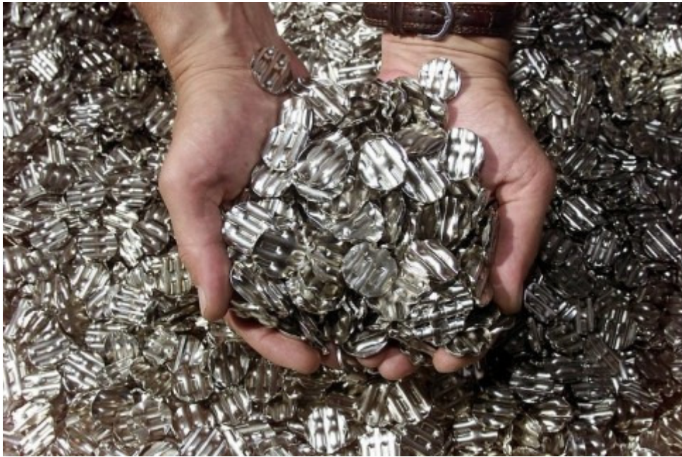
Unbrauchbar: Über die Landesbanken ausrangierte Markstücke werden mehrfach verbogen. Aus dem geschmolzenen Rohstoff werden später wieder Eurostücke geprägt.