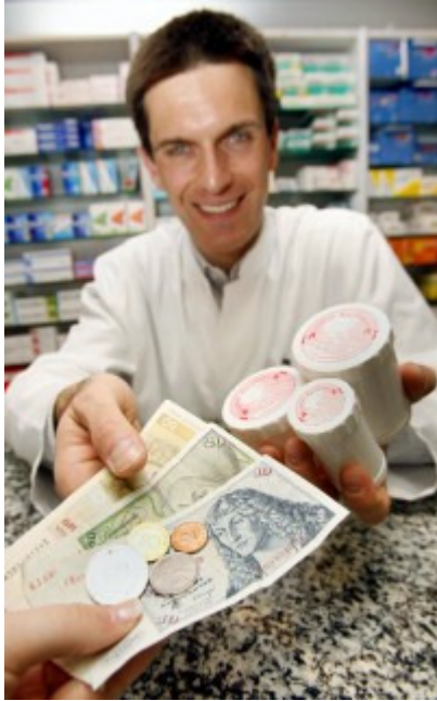
Und mancherorts konnten Kunden in Deutschland noch sehr lange in D-Mark einkaufen - wie in dieser Apotheke in Mainz.

Welt am Sonntag: Zurück zur Einführung des Stabilitätspakts. Wer war damals dagegen?