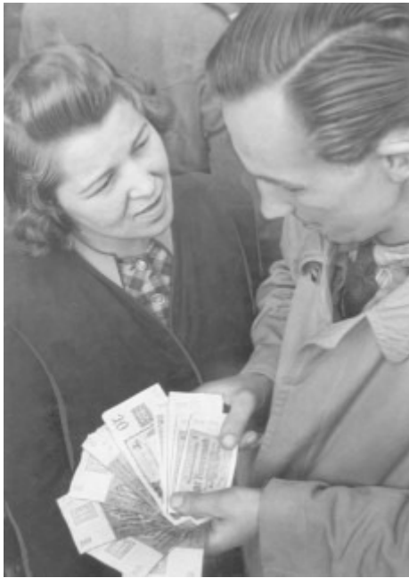
In den Westsektoren wurden bis dahin in Reichsmark berechnete Löhne, Gehälter und Mieten 1:1 umgestellt. Sparguthaben in Reichsmark verloren an Wert, sie wurden 10:1 übertragen. Glück hatte also, wer damals Haus oder Sachwerte wie Gold besaß. Auch Aktien blieben gleichwertig.