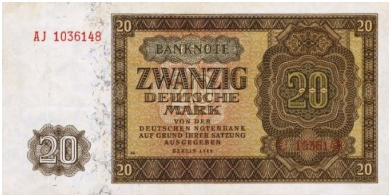
Auch der Ostsektor führte eine eigene Mark ein. Zunächst wurden eilig bisherige Reichsmark-Scheine mit Wertmarken überklebt. Deswegen hieß die Ost-Mark auch "Klebe-Mark" oder "Tapetenmark". Dieser Schein allerdings ist neu entworfen.