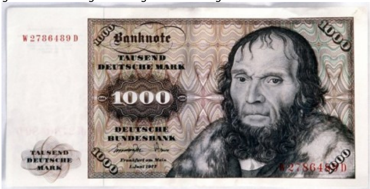
Doch es kam noch dicker: Die Bundesbank brachte 1964 den Tausender heraus. Der Schein zeigt den Magdeburger Theologen Johannes Scheyring (er lebte von 1454 bis 1516).

Die gute alte Mark: Am 20. Juni 1948 wurde die Wahrung D-Mark in den drei Westsektoren des von den Alliierten besetzten Deutschlands an die Bevolkerung ausgegeben. Damals gab es sogar 50-Pfennig-Scheine.