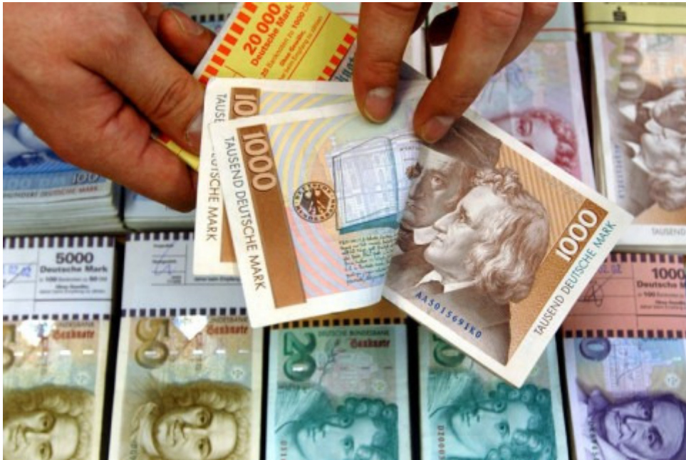
Der Euro ist zumindest bis 2006 ebenso stabil wie die D-Mark - seit einem guten Jahr nimmt die Inflation in der Eurozone jedoch deutlich zu. Doch viele misstrauen dem Euro nach wie vor...