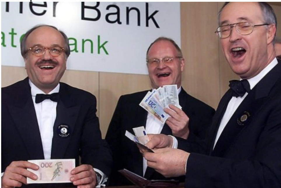
Foto: dpa Silvester 2001: Drei Männer lachen. Sie haben die ersten gültigen Euroscheine in den Händen. V.r. Bundesfinanzminister Hans Eichel, Bundesbankpräsident Ernst Welteke und der Chef der Dresdner Bank, Bernd Fahrholz. Das Geld gibt es noch, die Männer sind ihre damaligen Jobs längst los.

Foto: dpa Bereits der Maastricht-Vertrag der EU von 1992 sieht eine Währungsunion vor. In elf EU-Ländern galt ab 1999 auf dem Papier schon die gemeinsame Währung Euro. Kurz vor der Währungsreform am 1. Januar 2002 rollten dann die Geldtransporte durchs Land.