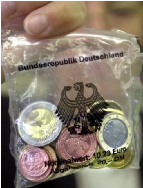
Die Euro-Zeit begann für die meisten Menschen ab 2001 mit dem Kauf eines Starter-Kits. Wert: 10,23 Euro - oder eben 20 D-Mark. Der Umrechnungskurs von Euro zu Mark lag bei 1:1,95583.