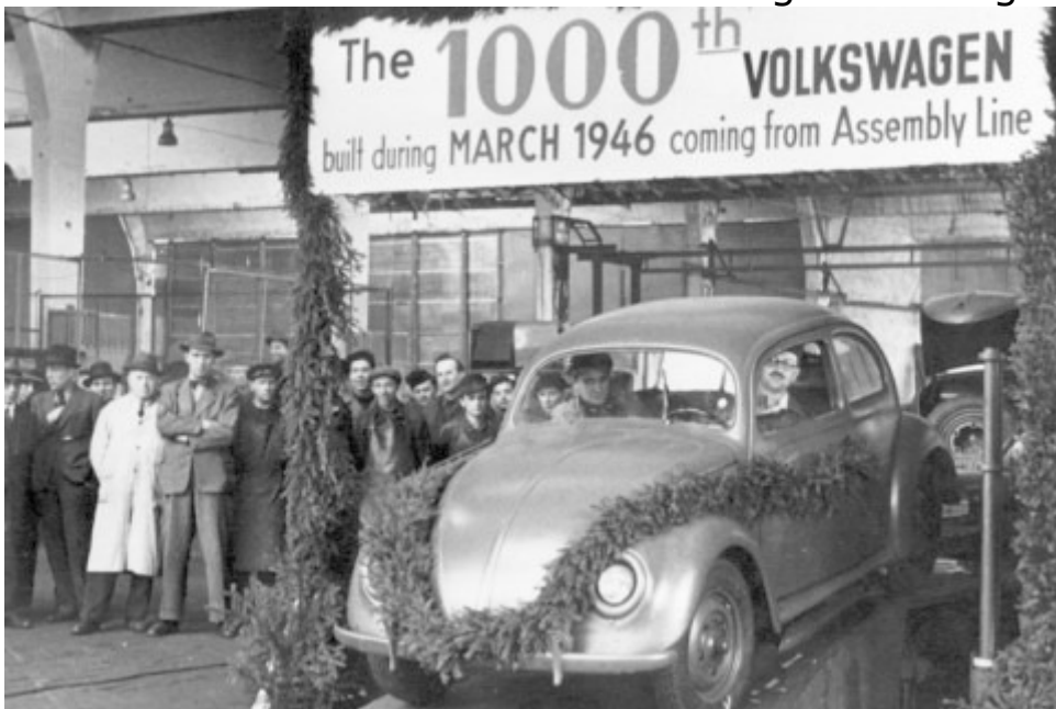
Foto: dpa Zum Vergleich: Ein VW Käfer kostete 1948 noch 5300 Mark.

Foto: dpa In den Westsektoren wurden bis dahin in Reichsmark berechnete Löhne, Gehälter und Mieten 1:1 umgestellt. Sparguthaben in Reichsmark verloren an Wert, sie wurden 10:1 übertragen. Glück hatte also, wer damals Haus oder Sachwerte wie Gold besaß. Auch Aktien blieben gleichwertig.