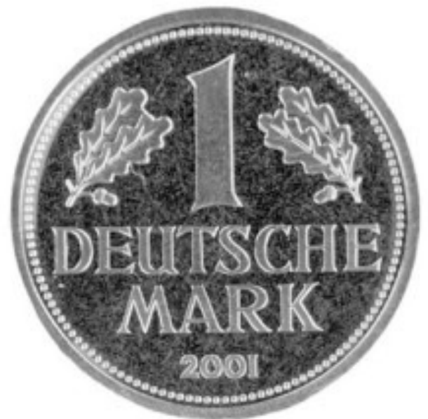
Die Deutschen lieben ihre Mark immer noch: Jeder Dritte will laut Umfragen die D-Mark wiederhaben. Ob das an der Geschichte liegt? Die ersten Markstücke gab es 1502 in der freien Reichsstadt Lübeck (l.).