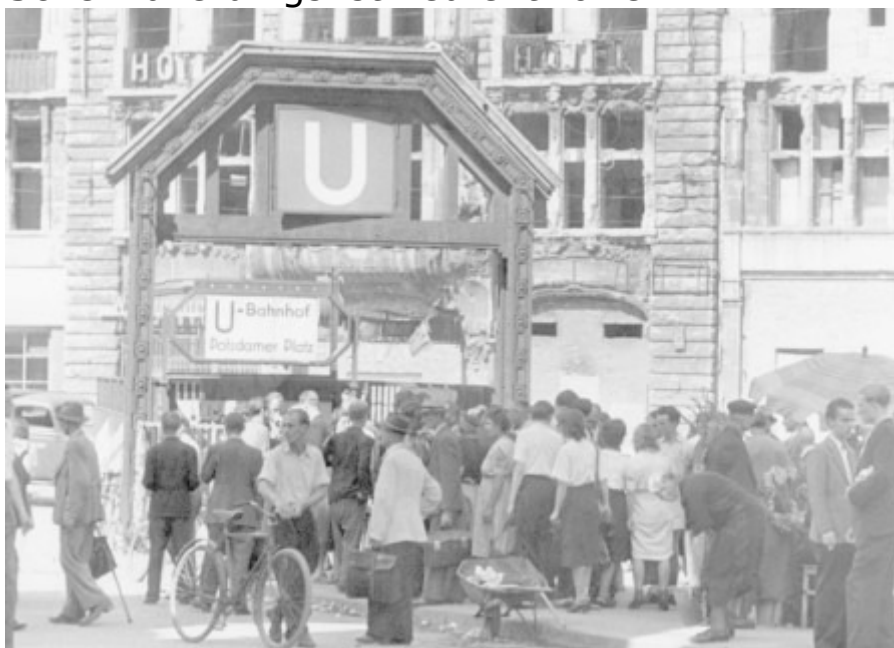
Die Sowjetzone zog am 23. Juni 1948 nach. Daher florierte bald der Tausch. Härtere D-Mark war zeitweise wie hier am Potsdamer Platz in Berlin bis zu 5 Ostmark wert. Damit konnten Westberliner im Osten günstig einkaufen.

Auch der Ostsektor führte eine eigene Mark ein. Zunächst wurden eilig bisherige Reichsmark-Scheine mit Wertmarken überklebt. Deswegen hieß die Ost-Mark auch "Klebe-Mark" oder "Tapetenmark". Dieser Schein allerdings ist neu entworfen.