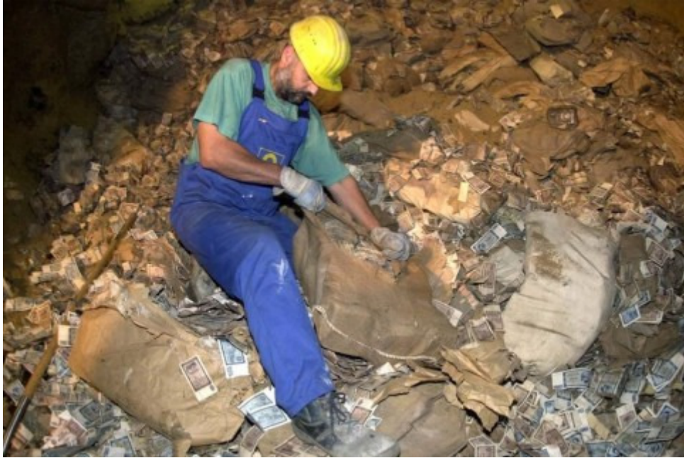
Das Ende der DDR-Mark: In einem alten Bergwerksstollen in Sachsen-Anhalt vergammelten etwa 100 Milliarden Ostmark jahrelang. Sie wurden später im Kraftwerk Buschhaus in Niedersachsen verbrannt.