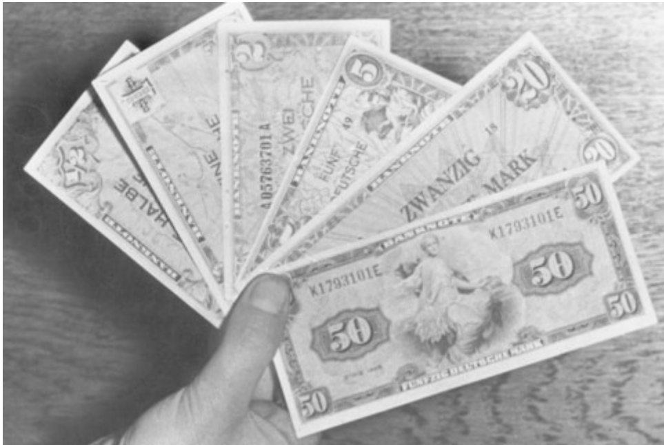
Die gute alte Mark: Am 20. Juni 1948 wurde die Wahrung D-Mark in den drei Westsektoren des von den Alliierten besetzten Deutschlands an die Bevolkerung ausgegeben. Damals gab es sogar 50-Pfennig-Scheine.